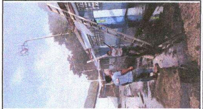
Foto 4: Lavado de costaneras, para despues cepillar, lijar y pintar, para luego colocar lámina, por lámina troquelada aluzinc calibre 26