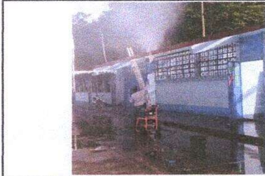
Foto 1: Lavado de costaneras, para despues cepillar, lijar y pintar, para luego colocar lámina, por lámina troquelada aluzinc calibre 26