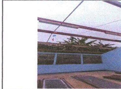
Foto 2: Retiro de láminas para despues colocar lámina, por lámina troquelada aluzinc calibre 26