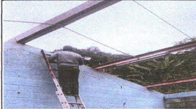
Foto 3: Retiro de láminas para despues colocar lámina, por lámina troquelada aluzinc calibre 26